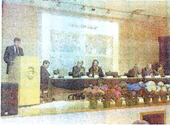
I vertici Bccv all'assemblea dei soci

I soci della Bccv sono 8.451 in Valle d'Aosta, in crescita del 9 per cento rispetto all'anno scorso. In occasione