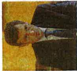
Il nostro è un bilancio assolutamente positivo, nonostante la difficile situazione economica del Paese