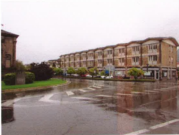
La sede della Bcc oggi. Sotto alcune immagini future

La ristrutturazione e l'ampliamento della sede della Banca di Credito Cooperativo Valdostana rivela il duplice scopo di creare un punto strategico della città di Aosta e cosa fondamentale, un centro polifunzionale aperto alle diverse esigenze dei propri soci e clienti, e non solo, per un nuovo modo di fare ed essere banca