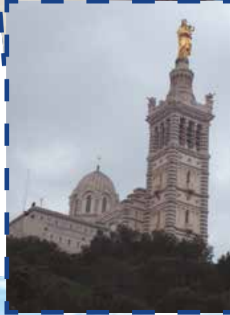
Partendo dall'alto: Cassis, Marsiglia, l'Isola Porquerolles e foto di gruppo a Hyères