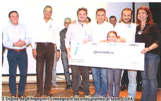
L'Ordine degli Ingegneri consegna il secondo premio al team CO4A