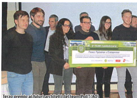
Terzo premio ai futuri architetti del team PoliT(AO)