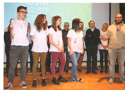
Premio Touchware ai ragazzi del Liceo classico di Aosta

HACKATHON AOSTA CITTA' CONNESSA / Il team Building si aggiudica la maratona di Aosta Future Camp