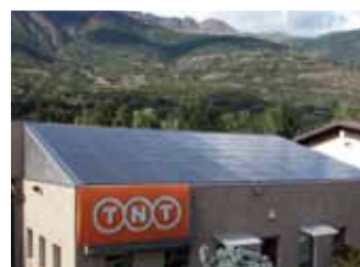
St. Christophe, 19,9 kWp