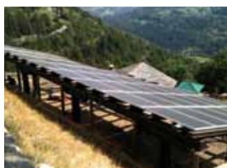
Allein, 9,6 kWp