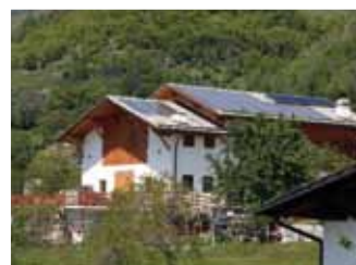
Porossan, 12,0 kWp