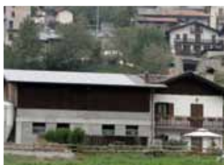
Nus, 10,08 kWp