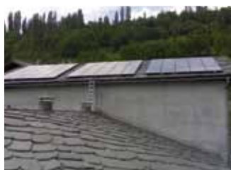
St. Pierre, 12,0 kWp