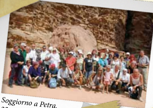
Soggiorno a Petra, 22-26 settembre