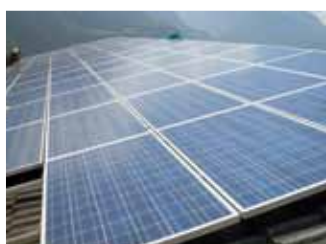
St. Pierre, 20,0 kWp