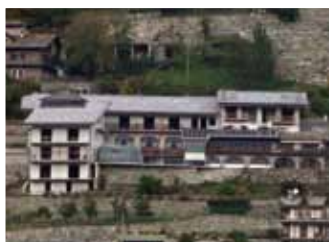
Sarre, 60,84 kWp