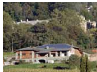
St. Christophe, 19,89 kWp