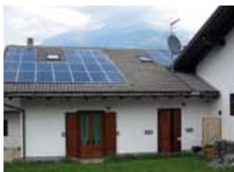
Charvensod, 5,85 kWp