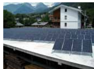
La Salle, 41,58 kWp