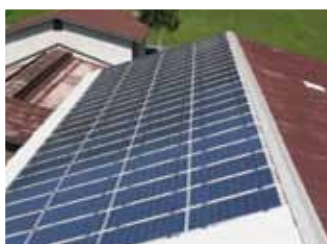
Nus, 19,8 kWp