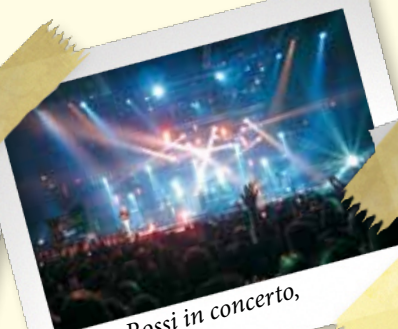
Vasco Rossi in concerto, 6 aprile