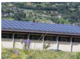
Pollein, 19,2 kWp