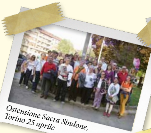
Ostensione Sacra Sindone, Torino 25 aprile