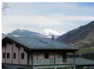
Chambave, 7,6 kWp