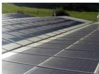
Brissogne, 91,26 kWp