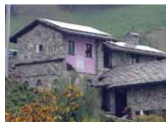
St. Christophe, 5,76 kWp