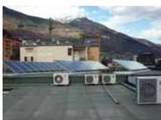
Aosta, 5,85 kWp