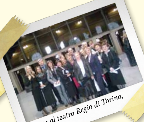
Serata al teatro Regio di Torino, 11 maggio