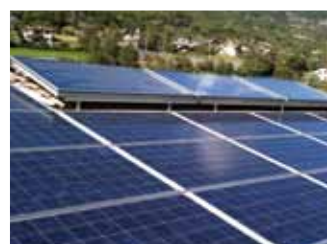
St. Christophe, 10,58 kWp