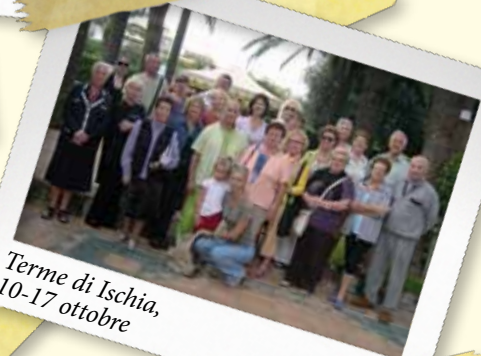
Terme di Ischia, 10-17 ottobre