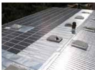
Verrayes, 65,1 kWp