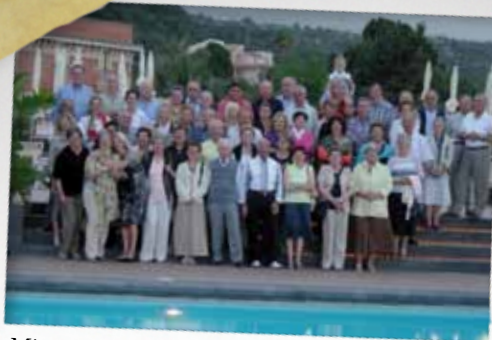
Minitour della Sicilia Orientale, 29 maggio - 2 giugno