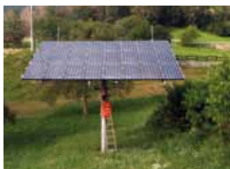
Introd, 5,4 kWp