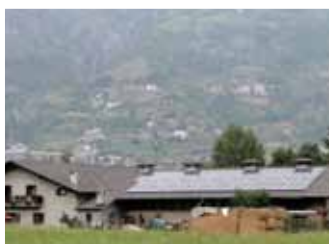
Gressan, 19,89 kWp