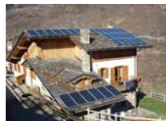
Gignod, 5,85 kWp

Per informazioni sulle condizioni contrattuali è inoltre possibile consultare i fogli informativi disponibili presso le filiali e sul sito internet della Banca.