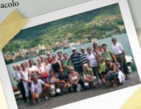
Lago di Iseo, 17-18 luglio