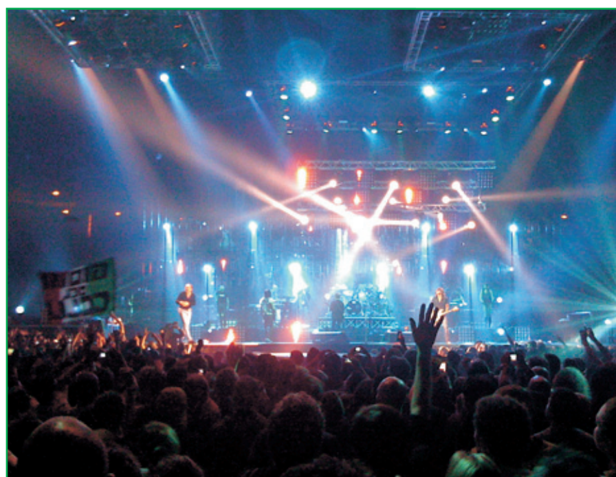
6 aprile, Vasco Rossi in concerto

Alcuni momenti delle iniziative organizzate dalla BCC Valdostana nel corso di questi primi mesi dell'anno