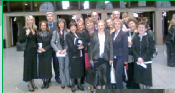
29 maggio - 2 giugno, Minitour della Sicilia orientale