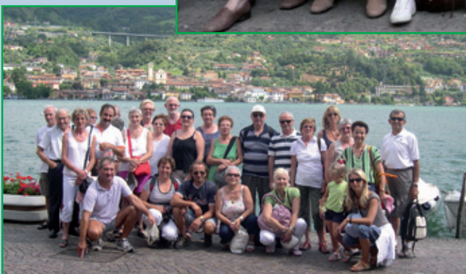
17-18 luglio, Lago d'Iseo