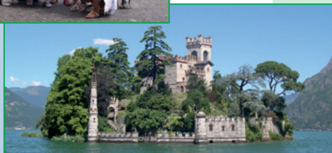
17-18 luglio, Lago d'Iseo