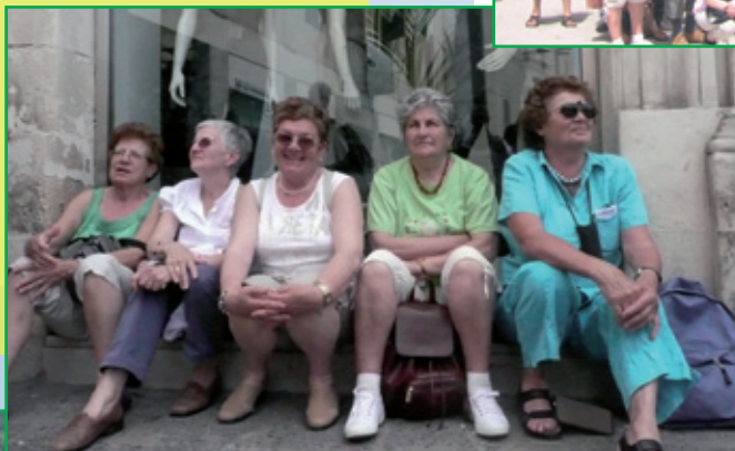
29 maggio - 2 giugno, Minitour della Sicilia orientale bellezze sicule...