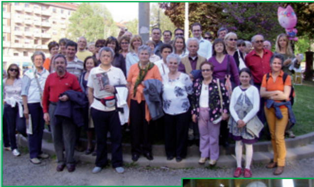
25 aprile, Ostensione della Sacra Sindone a Torino