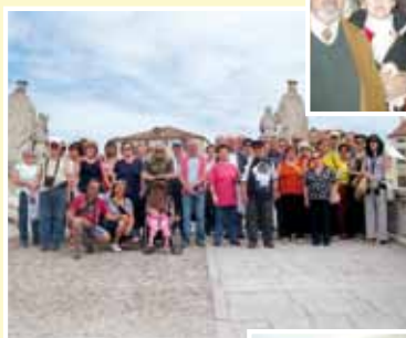
Ville venete 19-20-21 giugno