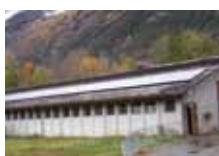
Coop. La Vache Rit, impianto fv 20 kWp, filiale di La Salle