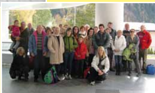
Terme di Burgerbad 14 novembre