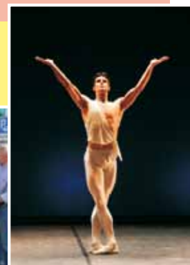
Bolle & Friends 27 luglio