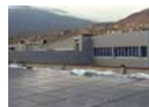
Immobiliare Cretaz Snc di Diotri, impianto fv 54 kWp, filiale di Aosta Arco d'Augusto