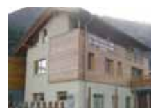
Piperno Claudia, abitazione a basso consumo, filiale di La Thuile