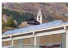
O.P.M. Srl, impianto fv 6,48 kWp, filiale di St. Pierre