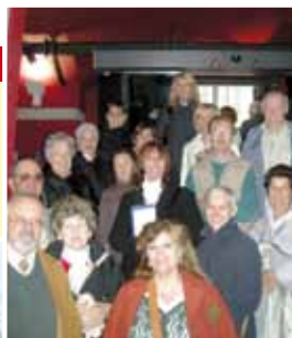
Oktoberfest 02-03-04 ottobre