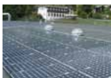
Flli Alberto Srl, impianto fv 60 kWp, filiale di La Salle