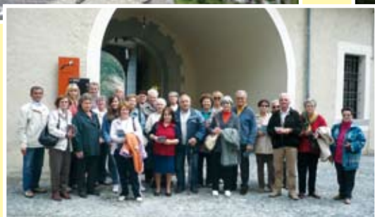
Forte di Bard 07/06/08