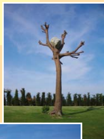
Reggia di Venaria Reale 10/05/08