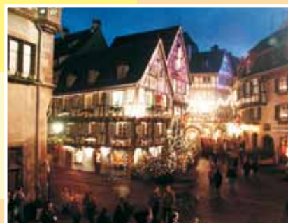
Alsazia 05-06-07-08 dicembre